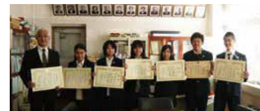
④ 中学生の「税についての作文表彰」 (平成25年度 優秀作品表彰のみなさん)