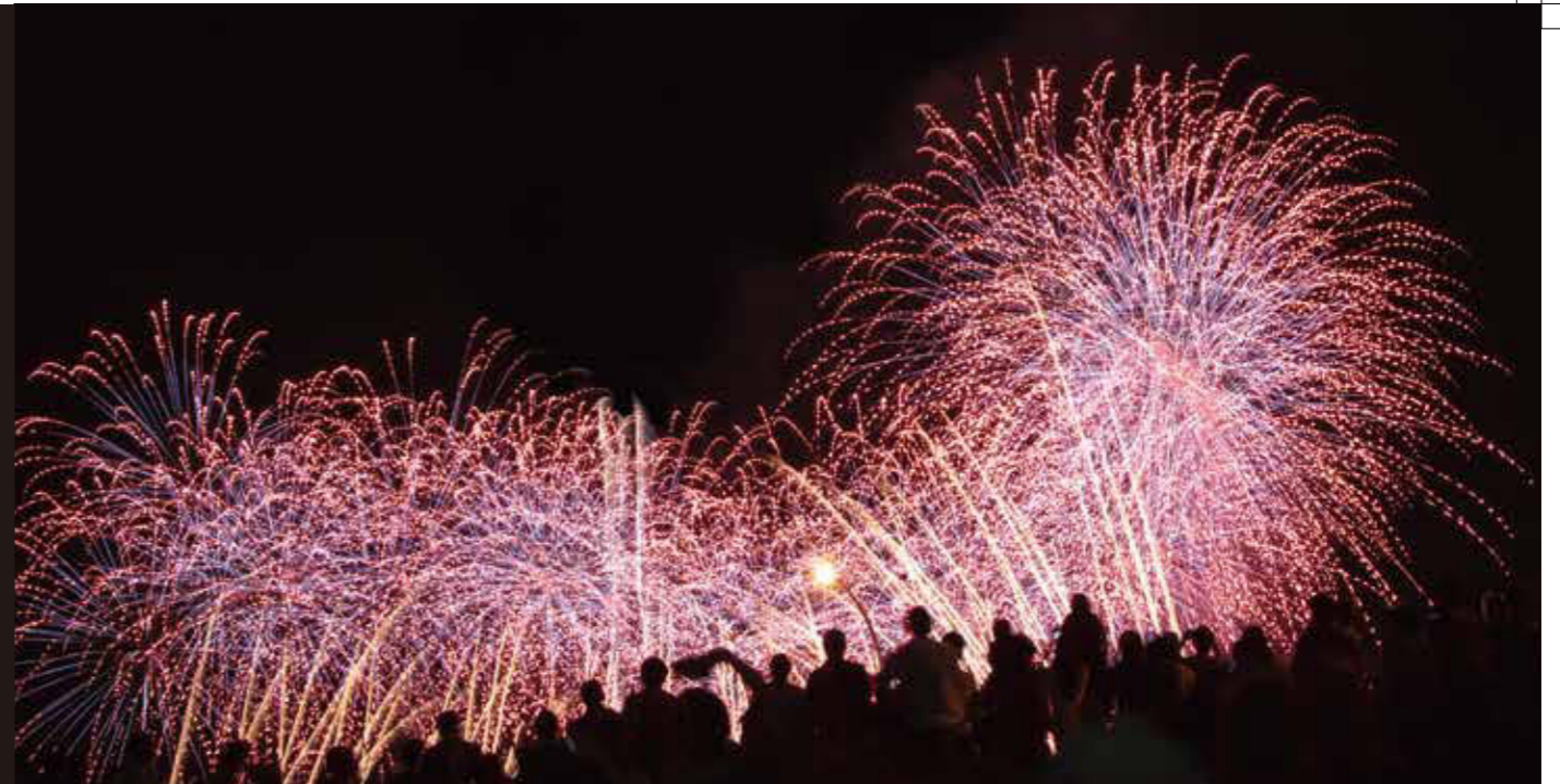
2014 たまがわ花火大会

玉川だより 平成26年9月15日発行 玉川納税貯蓄組合連合会 http://www.tamagawanairen.org/ 制作/玉川納税貯蓄組合連合会 広報部 電話 03(3700)4400