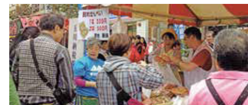
⑦ 尾山台フェスティバル