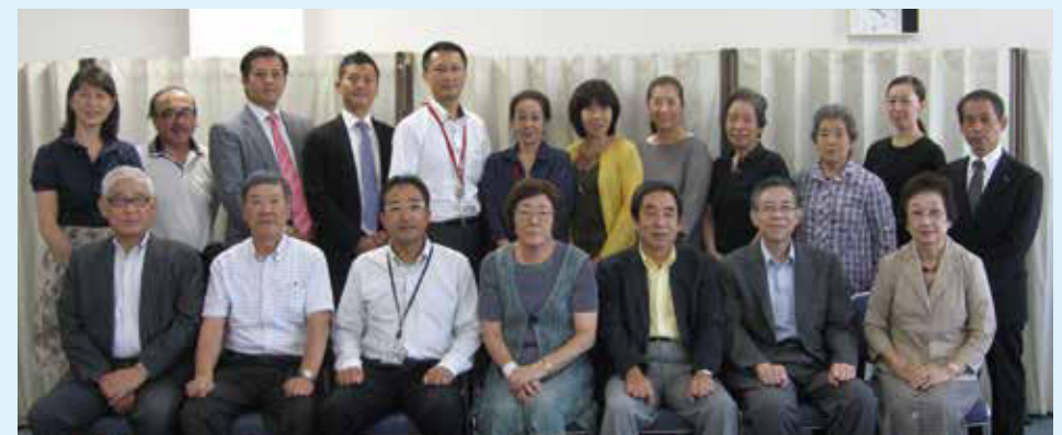
今年度も各部このメンバーを中心に活動してまいります