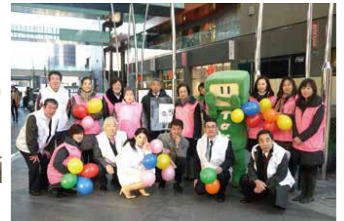
玉川納税貯蓄組合連合会【60周年記念イベント】