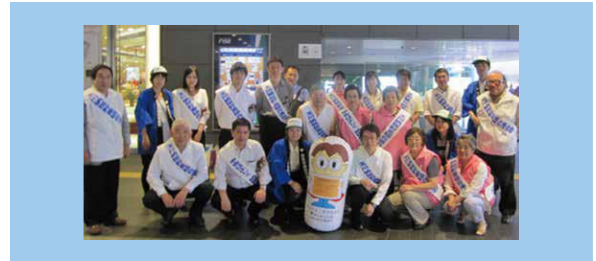
5月14日(水) 二子玉川駅改札

皆様の日頃の行いのおかげで、5月14日(水)は晴天に恵まれました。今年も例年どおり、二子玉川駅改札前にて、玉川納税貯蓄組合連合会様、世田谷区様、世田谷都税事務所の合同で、さらに玉川税務署様のご協力もいただき、盛大に春の納税キャンペーンを実施することができました。『納期内納税(自動車税、軽自動車税、固定資産税第一期、住民税第一期の納期周知)』、『口座振替の推進』のPRを行いました。