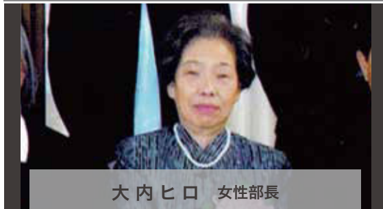
世田谷都税事務所長感謝状受賞者