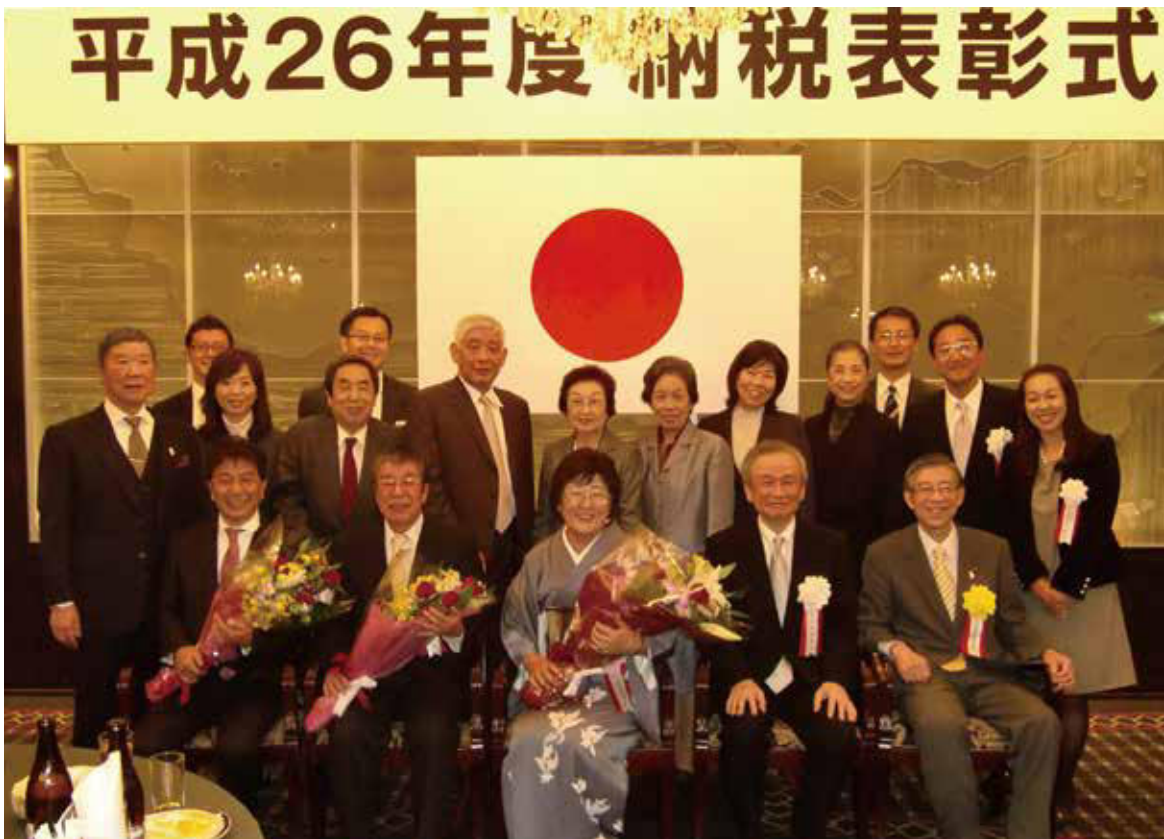
▲玉川税務署長と受彰者を囲んで