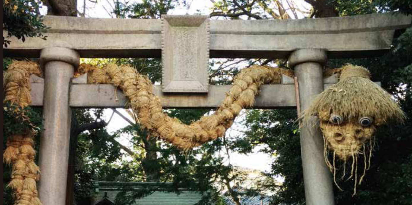
奥澤神社の大蛇

玉川だるり 平成27年2月15日発行 玉川納税貯蓄組合連合会 http://www.tamagawanaouren.org/ 制作 玉川納税貯蓄組合連合会 広報部 電話 03(3700)4400