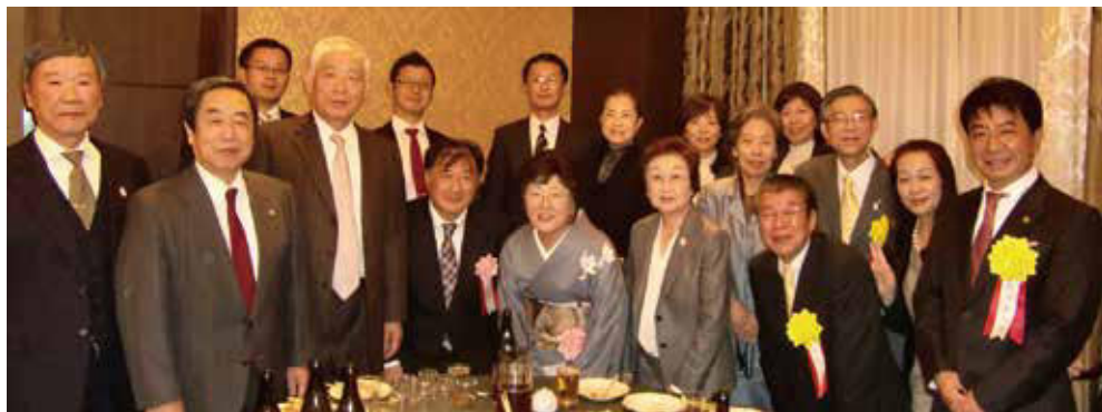
▶祝賀会にご出席の皆様