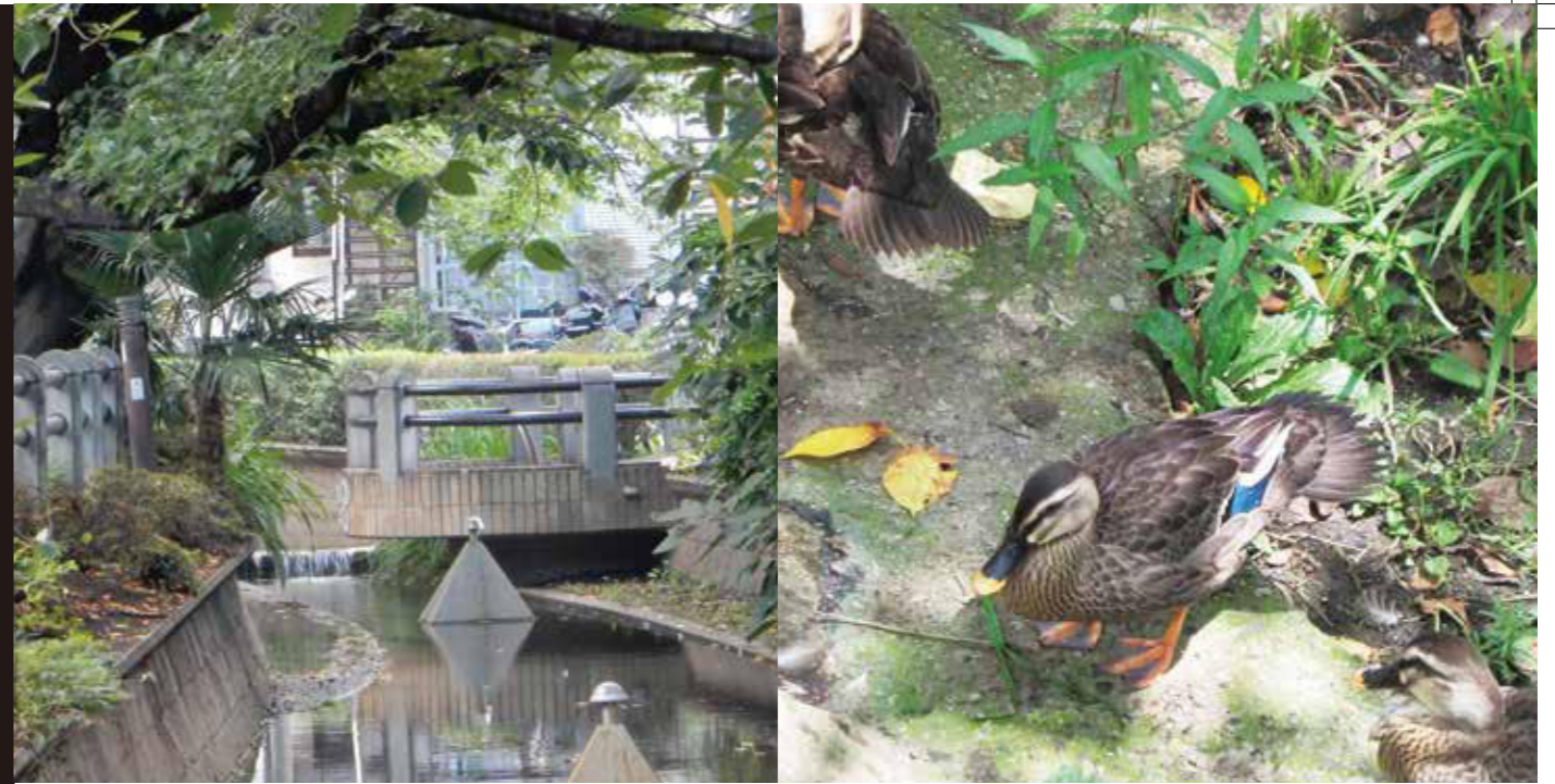
呑川緑道とかがも

玉川だより 平成27年9月15日発行 玉川納税貯蓄組合連合会 http://www.tamagawanairen.org/ 制作 玉川納税貯蓄組合連合会 広報部 電話 03 (3700) 4400