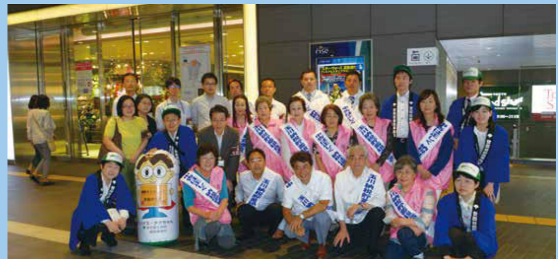
5月14日(木) 二子玉川駅改札前

今年も春の納税キャンペーンを二子玉川駅改札前にて実施しました。当日の東京の最高気温は28.6度(昨年より暑いです)、開始時間は午後1時半で、ひときわ暑い時間帯でした。その暑さの中を、玉川納税貯蓄組合連合会の皆様には大勢ご参加いただきました。本当にありがとうございました。三年連続天気に恵まれておりますのは、皆様の日頃の行いのおかげでございます。来年もよろしくお願ひいたします!