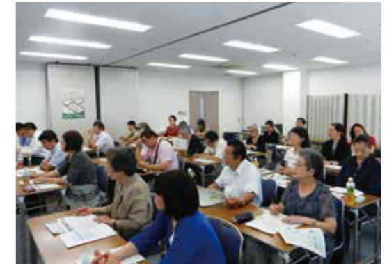
マイナンバー研修会