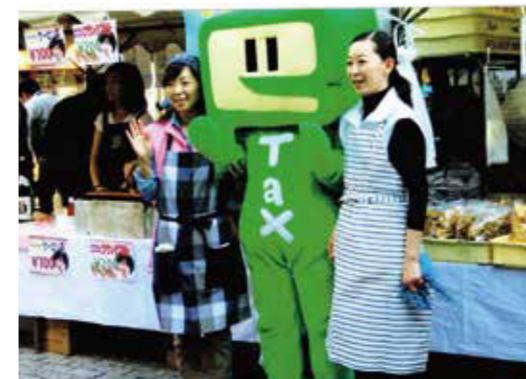
尾山台フェスティバル