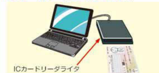
ICカードリーダライタ

※マイナンバーカードの交付に関するご質問については、住民票のある市区町村窓口へお問合せください。