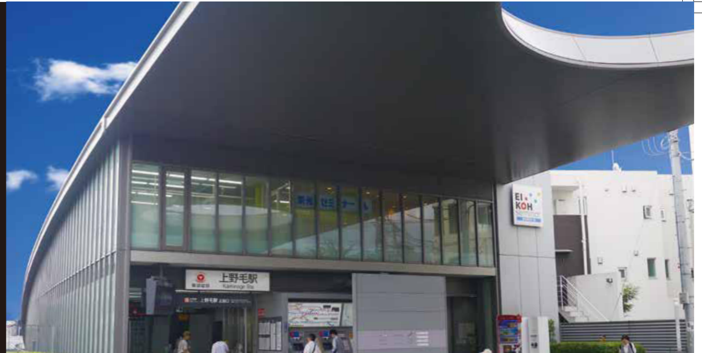
東急大井町線 上野毛駅周辺の風景