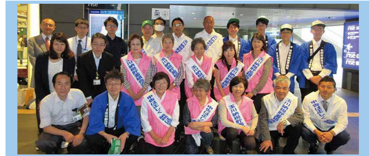
5月11日(水) 二子玉川駅改札前

今年も、玉川納税貯蓄組合連合会の皆様のご協力をいただき、5月11日(水)、二子玉川駅にて春の納税キャンペーンを実施することができました。お忙しい中、大勢の方にご参加いただきまして、この場をお借りしまして深く御礼申し上げます。3年連続好天が続きましたが、今回はついに、雨予報。二子玉川は幸いにも屋根のある場所ですが、同日開催の経堂駅前・三軒茶屋駅前は屋根がありませんから、当日まで生きた心地がしませんでした。朝のうちは残っていた雨も、13時30分に二子玉川駅に集合する頃にはすっかり回復し、やや蒸し暑いくらいになりました。