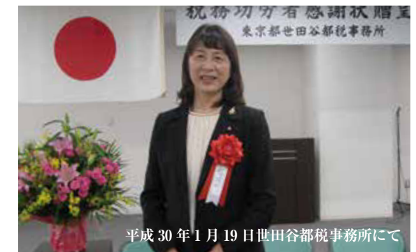
平成30年1月19日世田谷都税事務所にて