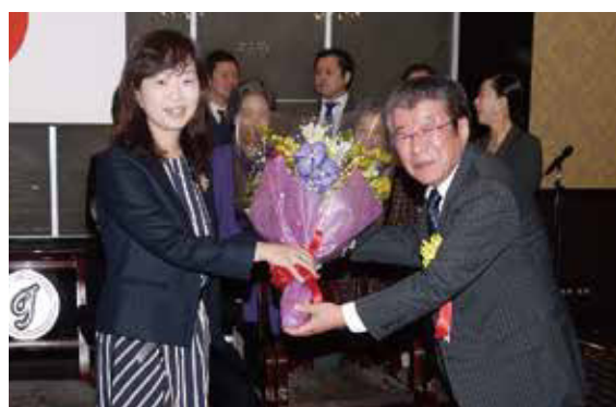
▲黒丸 様 (右)