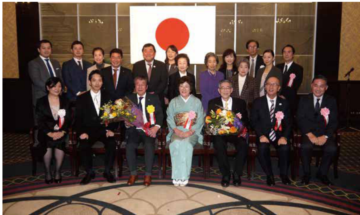
▲ 玉川税務署長と受彰者の皆様