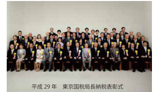
平成29年 東京国税局長納税表彰式

この度ははからずも受彰の栄に浴しました。これもひとえに、玉川税務署長をはじめ先輩諸氏ならびに会員の長年に亘る心温かいご指導ご支援の賜と深く感謝申し上げます。今後はこの榮譽に恥じる事のないよう一層精進して、僅かなりともご芳情に報いたいと存じます。誠にありがとうございました。