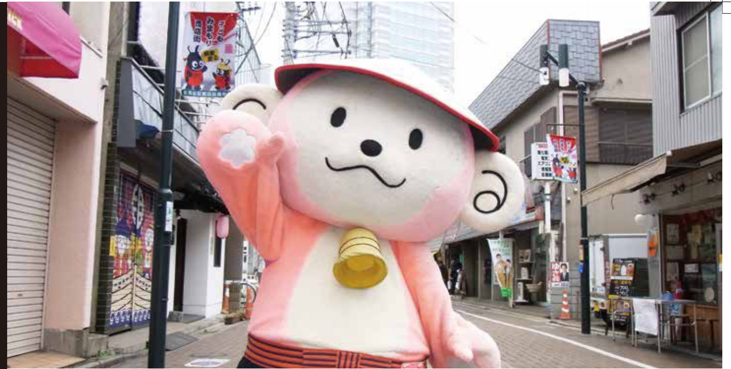
用賀のよっきー