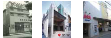
1958年創業時の用賀店 用賀店 二子玉川店

60年前、用賀からスタートした新聞販売。 今日も皆様の元へ真心込めて配達しています。