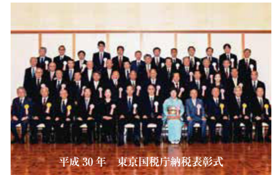
平成30年 東京国税庁納税表彰式

この上ない栄誉に恥じぬよう、皆様のご指導を頂きながら、今後も納税意識の高揚と啓蒙活動に努力していく所存です。今後ともご指導、ご鞭撻のほど、よろしくお願い申し上げます。