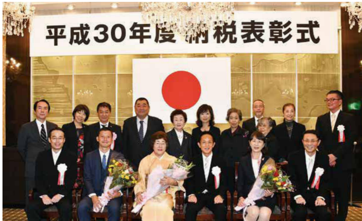
▲ 玉川税務署長と受彰者の皆様