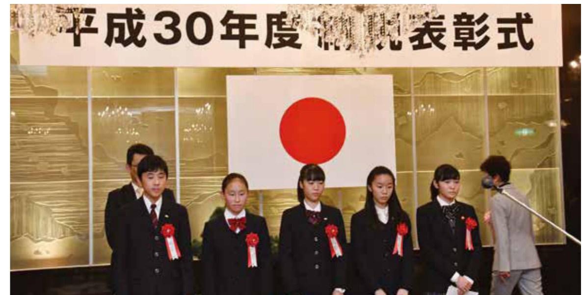
上位入賞作品の皆さん

本事業の実施にあたり、応募いただきました生徒の皆様、ご協力いただきました校長先生はじめ各先生方、玉川税務署、東京都世田谷都税事務所、世田谷区役所、東京税理士会玉川支部の皆様にご心より御礼申し上げます。