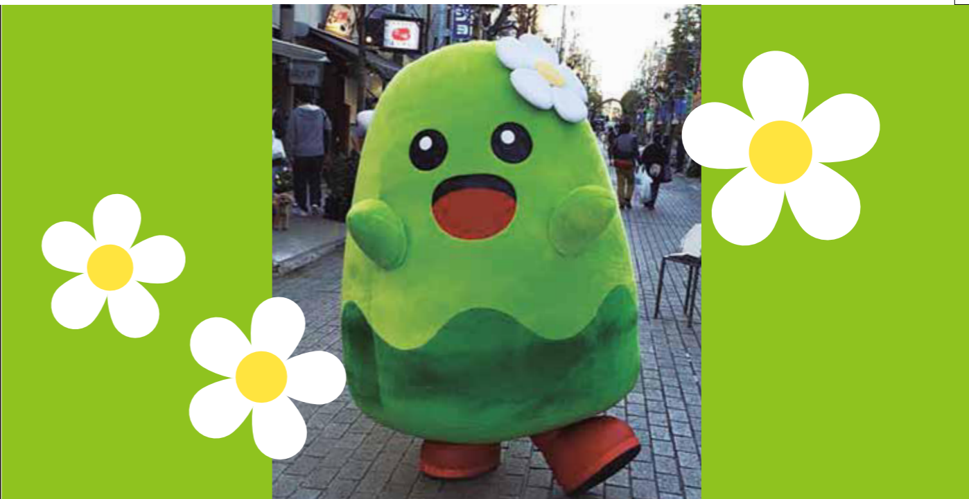
尾山オッポン

玉川だより 平成31年2月15日発行 玉川納税貯蓄組合連合会 制作/玉川納税貯蓄組合連合会 広報部 電話 03(3700)4400