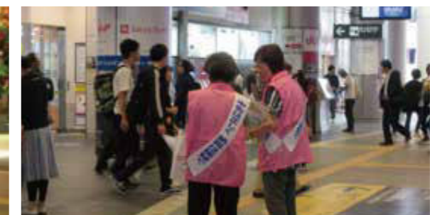
今年も、玉川税務署から署長をはじめ、皆様にご参加いただきました