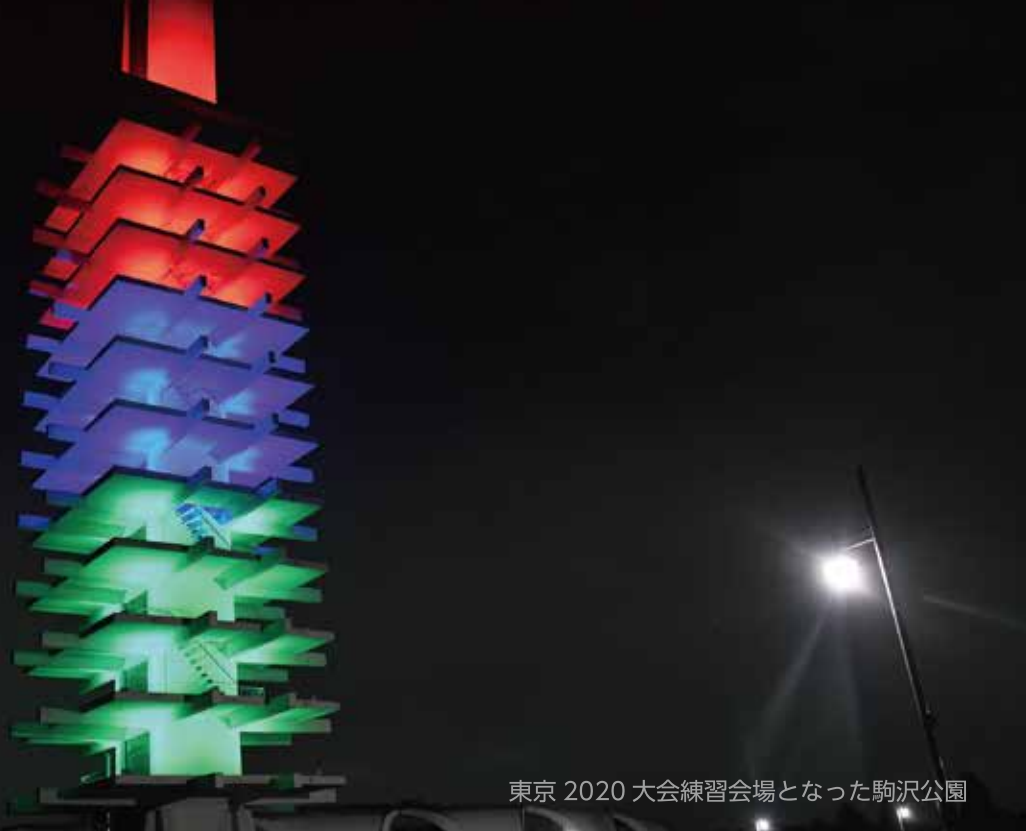
東京 2020 大会練習会場となった駒沢公園